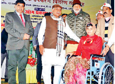
जिला रेडक्रॉस समिति की ओर से आयोजित इस जिला स्तरीय कार्यक्रम में भारतीय कुत्रिम अंग निर्माण (एलिनको) द्वारा भारत सरकार के सामाजिक न्याय एवं अधिकारिका मंत्रालय के तत्वाधान में 250 दिव्यांगजनों को बैटरी चलित तिपहिया साइकिल व सहायक उपकरण दिए गए। इसके लिए भारत सरकार की इंडियन ऑयल कॉरपोरेशन लिमिटेड के सीएसआर योजना के सौजन्य से लगभग 60 लाख रुपये खर्च किए गए हैं।

महेन्द्रगढ़। जिला रेडक्रॉस समिति की ओर से आयोजित इस जिला स्तरीय कार्यक्रम में 250 दिव्यांगजनों को बैटरी चलित तिपहिया साइकिल व सहायक उपकरण दिए गए। इसमें बैटरी चलित तिपहिया साइकिल 84, ट्राई साइकिल 86 कील चेंबर व 64 को अन्य सहायक उपकरण दिए गए।