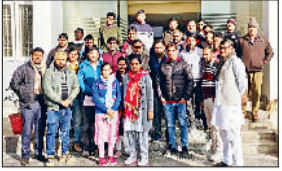
महेन्द्रगढ़। रेली का निमंत्रण देते संघर्ष समिति के सदस्य।