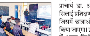
कनीना। मोहनपुर विद्यालय में आयोजित कैम्पस प्लेसमेंट में हिस्सा लेते विद्यार्थी।