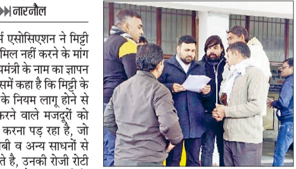
नारनौल। ज्ञापन सौंपते एसोसिएशन के सदस्य।

आल हरियाणा अर्थ मूवर्स एसोसिएशन ने मिट्टी के कार्य को माइनिंग में शामिल नहीं करने के मांग को लेकर बुधवार को मुख्यमंत्री का नाम का ज्ञापन तहसीलदार को सौंपा। जिसमें कहा है कि मिट्टी के काम पर माइनिंग विभाग के नियम लागू होने से मिट्टी से संबंधित काम करने वाले मजदूरों को भारी परेशानी का सामना करना पड़ रहा है, जो लोग ट्रैक्टर, हाइवा, जेसीबी व अन्य साधनों से मिट्टी ढुलाई का कार्य करते हैं, उनकी रोजी रोटी पर बहुत विपरित प्रभाव पड़ रहा है। इन साधनों के साहरे जो लोग काम करते हैं, माइनिंग के नियमों के तहत उनके साधन जब्त होने पर भारी जुर्माना देकर साधन को छुड़ाना पड़ता है, यह जुर्माना दो लाख से लेकर बीस लाख तक भी हो सकता है।