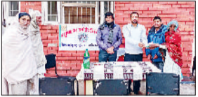
नारनौल। कैम्प में दवाई वितरित करते हुए।

महेन्द्रगढ़। पेंशन बहाली संघर्ष समिति की ओर से बुधवार को विभिन्न विभागों में 11 फरवरी को जॉर्ड में आयोजित होने वाली पुरानी पेंशन बहाली महा रेली के लिए जनसंपर्क अभियान चलाया गया। जिसमें सभी विभागों के कर्मचारियों को रेली में शामिल होने का निमंत्रण दिया गया। क्लेरिकल एसोसिएशन के राज्य महासचिव अमित यादव ने संघर्ष समिति को आश्वासन दिया महेन्द्रगढ़ क्षेत्र से लिफ्टिक रेली में बढ़-चढ़कर हिस्सा लेंगे।