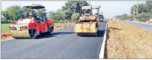
नारनौल। निर्माणाधीन स्टेट हाईवे नारनौल-दादरी मार्ग और वन विभाग आरक्षित किया गया वन क्षेत्र।

विकास के नाम पर हर साल नई सड़कें बनाई जाती हैं और कई पुरानी सड़कों को चौड़ा किया जाता है, लेकिन इसके बदले जमीन मालिक यानि किसानों को उसका पैसा मिल जाता है, किन्तु इसकी एवज में हर साल अनगिनत पेड़-पौधे बलि अकाल ही बलि चढ़ा दिए जाते हैं। इस कारण धरा की हरियाली घट रही है और प्रदूषण बढ़ रहा है। इस समस्या से बचने के लिए सरकार ने हल निकाला है, जिसके तौर पर सरकार अब जहां भी नई सड़कें बनाएंगी चौड़ी करेंगी, या फिर अन्य परियोजनाओं को सिरे चढ़ाएंगी, उसके बदले में उजाड़ गए पेड़-पौधों की तुलना में नए पेड़-पौधे लगाए जाएंगे। इसके लिए प्रदेश में करीब पांच हजार एकड़ जमीन की तलाश की जा रही है। पीडब्ल्यूडी यह जमीन खरीदेगा और वन विभाग को देगा। इसी कड़ी में पीडब्ल्यूडी विभाग शुरूआती तौर पर महज पांच एकड़ जमीन की तलाश कर रहा है, ताकि पेड़-पौधों काटने की एवज