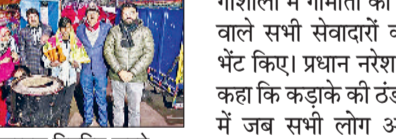
नारनौल। कम्बल वितरित करते रोटरी क्लब सदस्य।

रोटरी क्लब की ओर से कड़ाके की सर्दी के मौसम को देखते हुए हर वर्ष की भांति इस वर्ष भी सड़क किनारे रहने वाले जरूरतमंद लोगों, झुग्गी-झोपड़ियों में रहने वाले असहाय जरूरतमंदों व शहर की विभिन्न गोशालाओं में गौमाता की सेवा करने वाले सेवादायों को कम्बल वितरित किए। रोटरी क्लब सदस्यों ने कम्बल ओढ़ाकर अपना अभियान शुरू किया तथा बुधवार प्रातः गौमाता उपचारशाला, निजामपुर रोड स्थित श्री अनाथ गोशाला व सिंघाना रोड स्थित नंदी