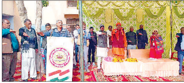
सतनाली मंडी। नागरिकों को शपथ दिलाते सांसद चौधरी धर्मवीर सिंह।

आगामी 26 जनवरी तक चलाई जाने वाली विकसित भारत जन संवाद संकल्प यात्रा बुधवार को गांव डालनवास व गादडवास पहुंची। गांव डालनवास व गादडवास में सांसद चौधरी धर्मवीर सिंह ने बतौर मुख्यातिथि शिरकत की व विकसित भारत की शपथ दिलाई। मुख्यातिथि ने विभागों द्वारा