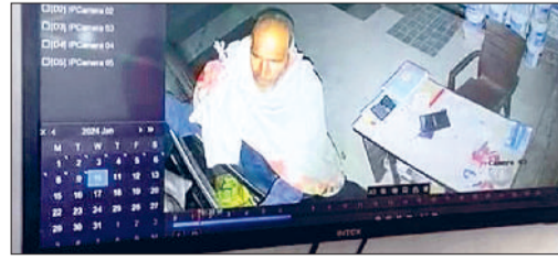
नारनौल। सीसीटीवी फुटेज में कैद हुआ चोर।

इन दिनों ठिठुरने वाली सर्दी का मौसम उफान पर है। जाहिर है रात के समय लोग जल्द दुकान को बंद कर घर लौट रहे हैं। इसी वजह से चोरी की वारदात भी बढ़ने लगी है। रही सही कसर नगर परिषद प्रशासन की कमियों ने पूरी कर दी। दरअसल, रेवाड़ी रोड पर बीते छह माह से दोनों तरफ लगाई गई स्ट्रीट लाइट बंद पड़ी है। करीब 80 में से 10 ही ऑन हैं। सड़क किनारे जब अंधेरा होगा तो दुकानों में चोरी