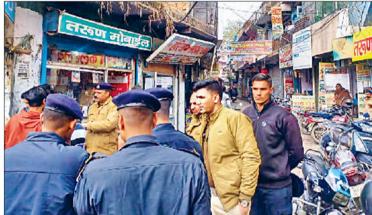
नारनौल। तरुण लैब गली में युवकों से पूछताछ करती पुलिस।

शहर में शिक्षण संस्थानों के इंद-गिर्द पुलिस सुरक्षा की जरूरत है। यहां कई बार झगड़े होते हैं। डर के मारे कोई लिखित शिकायत पुलिस को नहीं करता। इस वजह से पुलिस भी कुछ नहीं कर पाती। इसी तरह की वारदात इन दिनों बस स्टैंड के पास तरुण लैब गली में स्थित कई कोचिंग सेंटरों के बाहर व अंदर होना अब आम बात हो चली है। तीन दिन पहले यहां एक एकेडमी के अध्यापक को भी कुछ युवक पीटकर चले गए। जब मामला एसपी तक पहुंचा तो महावीर पुलिस चौकी की टीम अलर्ट मोड़ में आ गई। पीठित टीचर की शिकायत पर गांव खटोटी कलां वासी तीन नामजद के खिलाफ केस भी दर्ज किया। अब बीते दो दिनों से लगातार इस परि्या में पुलिस गश्त पर है और बेवजह घूमने वाले युवकों से पूछताछ करने का अभियान चलाए हुए है।